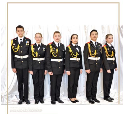
Кадеты Школы 630