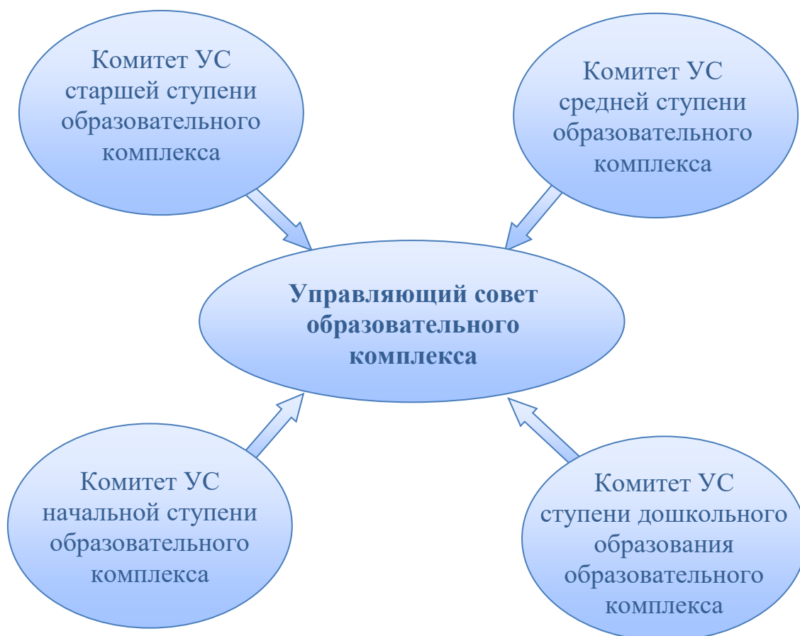
Рис.2. Управляющий совет образовательного комплекса. Второй вариант организации.

соответствующей ступени (структурного подразделения) – это вопрос открытый и ответ на него зависит от объема функций и полномочий комитета. То же самое можно сказать и в отношении «структурно-территориального» комитета, рассмотренного в первом варианте.